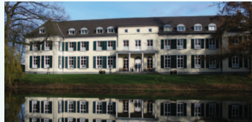
Hotel Schloss Gnadenthal - Kleef Gnadenthal 8 | 47533 Kleve | +49 2821 29080 | www.gnadenthal.nl

Op onze website vindt u een lijst van gekwalificeerde begeleiders/-sters, die opgeleid zijn in de Integratieve Ademtherapie www.instituut-ademtherapie.nl