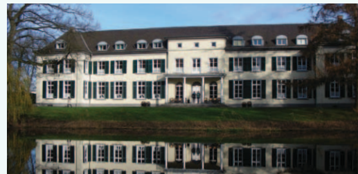
Tagungshotel Schloss Gnadenthal Gnadenthal 8 | 47533 Kleve | 02821 29080 | www.gnadenthal.de

Auf unserer Internetseite finden Sie eine Liste qualifizierter Begleiter/-innen, ausgebildet in Ganzheitlicher Integrativer Atemtherapie www.institut-atemtherapie.de